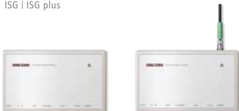
ISG | ISG plus

Das ISG plus bietet zusätzlich die Möglichkeit, zukünftige variable Stromtarife beziehungsweise eigenproduzierten PV-Strom optimal zu nutzen.