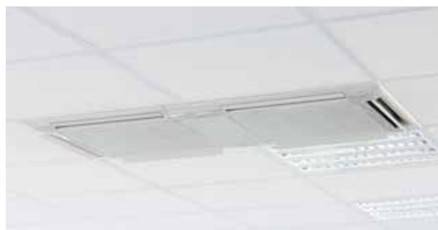
Kühlkassetten in den abgehängten Decken regulieren die Raumtemperatur.

Der aktive Kühlbetrieb endet, sobald die Raum-Ist-Temperatur die festgelegte Raum-Soll-Temperatur erreicht hat. Insbesondere bei passiver Kühlung liegen die Bereitstellungskosten für eine Kühlung deutlich unter den Kosten für eine herkömmlichen Klimatisierung.